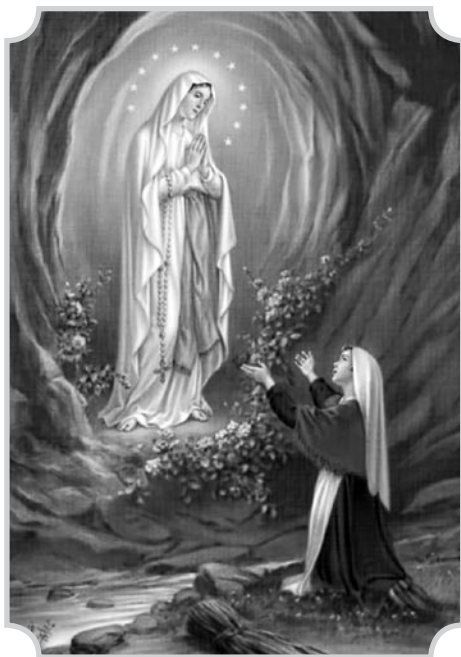
Zjevení Panny Marie v Lourdech v roce 1858 (slavnost 11. února).

Ain Karim – měsíčník římskokatolické farnosti Ostrava-Zábřeh, registrován na MKČR č. E13947. Vydává Římskokatolická farnost Ostrava-Zábřeh, U zámku 6, IČO 45210446, tel.: 599 097 086. Příspěvky zasílejte na: ainkarim@centrum.cz Internet: www.farnostoz.cz Vedoucí redaktor: o. Vítězslav Řehulka Redakční rada: o. Jakub Dominik Štefík, o. Václav Tomiczek, M. Domašik, M. Staňková, F. Böhmová, L. Stulová Grafická úprava a sazba: J. Böhm Číslo 131 dáno do tisku 8. února 2014